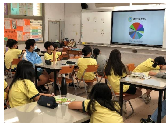
1120512 約會暴力+跟蹤騷擾融入輔導課