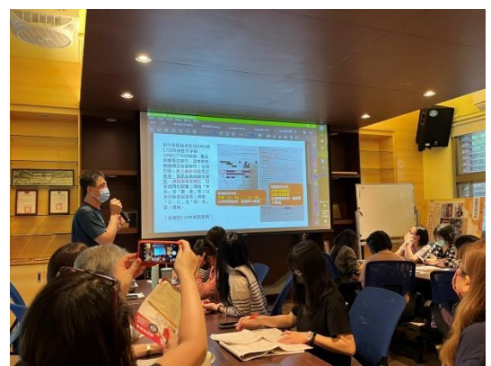
1120508 依性別平等調整校內表單網站宣導(行政會議)