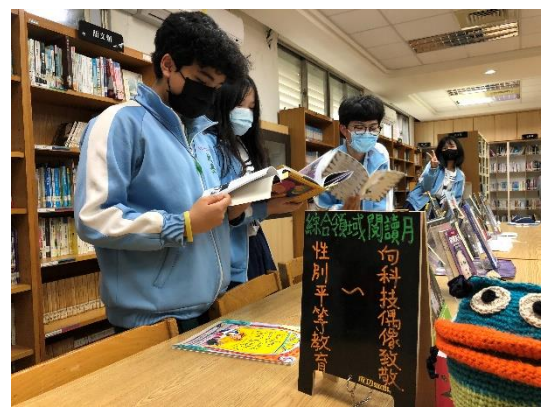
1120425 綜合領域閱讀月(性別平等教育向偶像致敬)