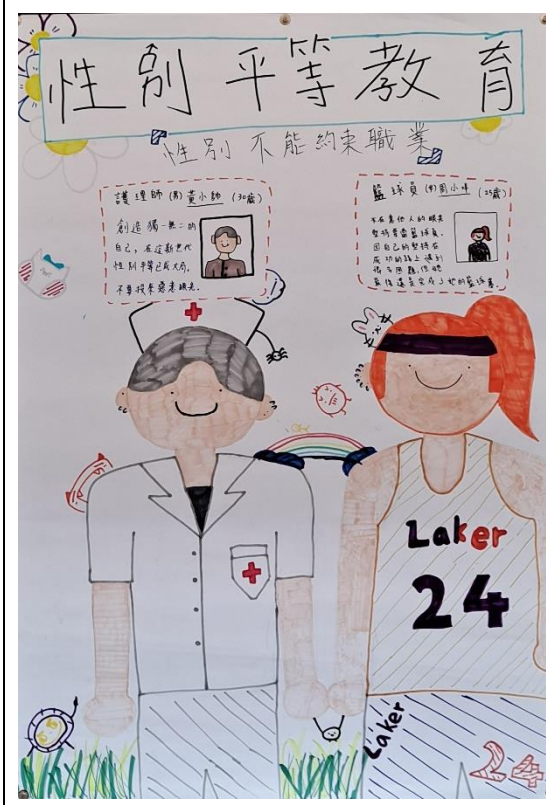
1120509 班級海報競賽(性別平等)