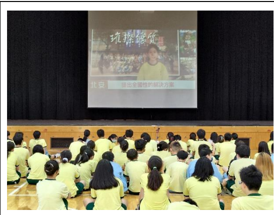
1120530 朝會(月經平權宣導)