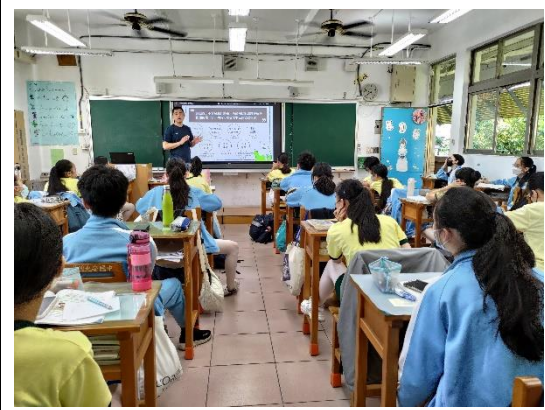
1120517 網路數位性別暴力入班宣導