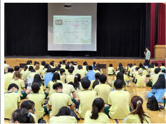
1120630 休業式(性別平等+性騷+數位性別暴力)