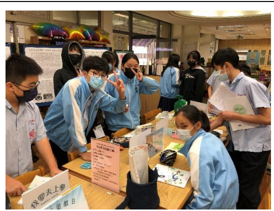
1120425 輔導室性平宣導年度主題(性平素養與科技生活)